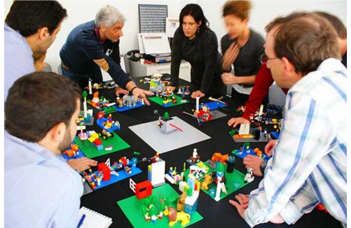
LEGO® SERIOUS PLAY®-meeting 100% participatie