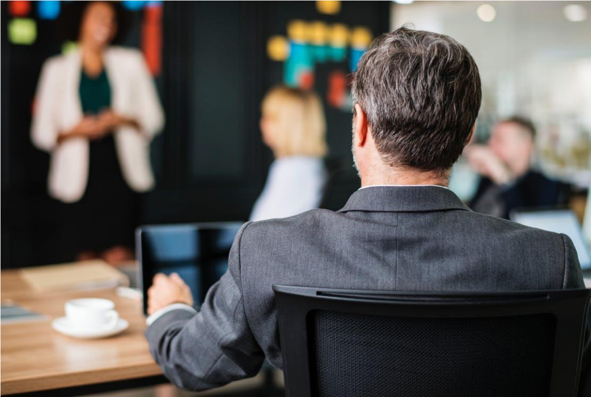
Klassieke meeting 20% participatie